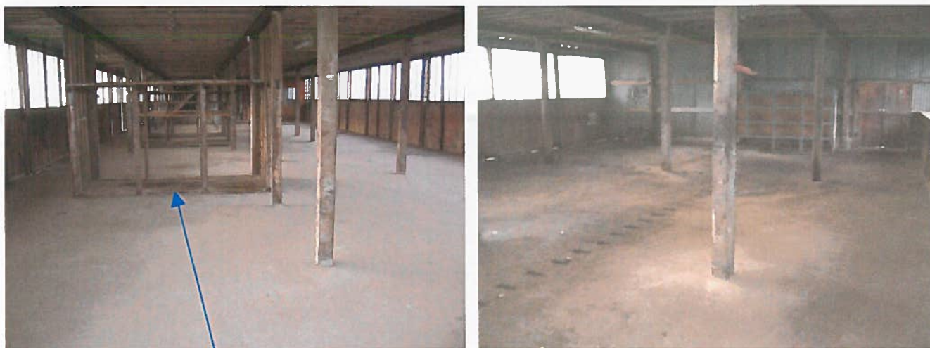
Compartiments de stockage de pièces

Les photos ci-dessous présentent l'intérieur du bâtiment :