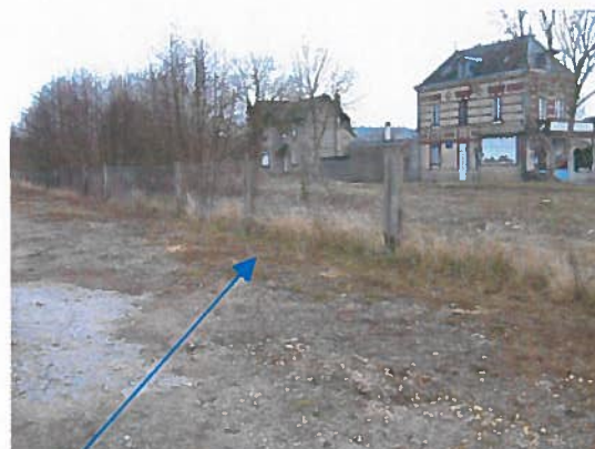
Zone de stockage du matériel