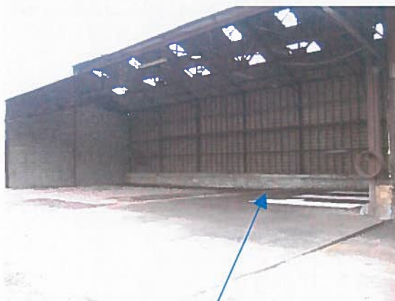
Zone de la fosse enterrée de récupération des huiles

Lors de notre visite sur site, nous n'avons pas relevé de trace de pollution visuelle sur cette zone.