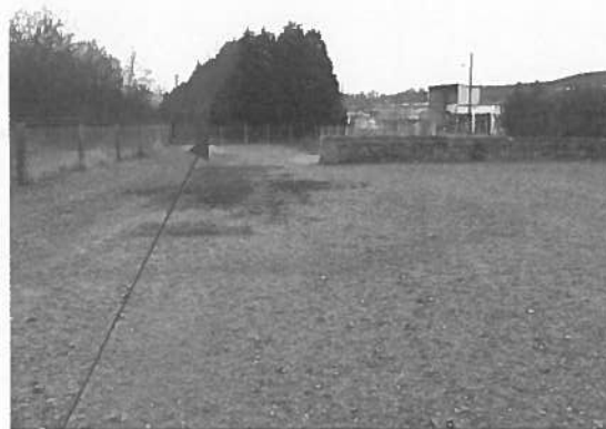
Zones de stockage de matériel agricole