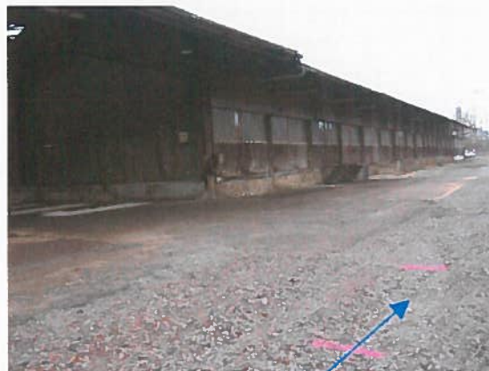
Emplacement de l'ancienne cuve enterrée